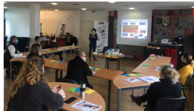
Atelier sur l'équilibre alimentaire