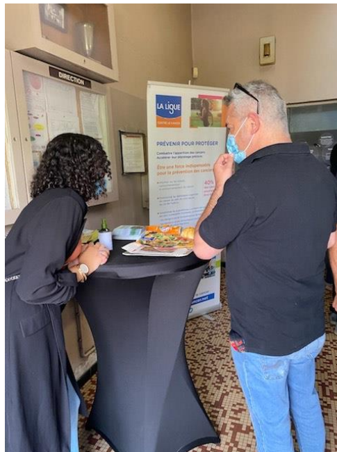
Stand autour d'un quiz