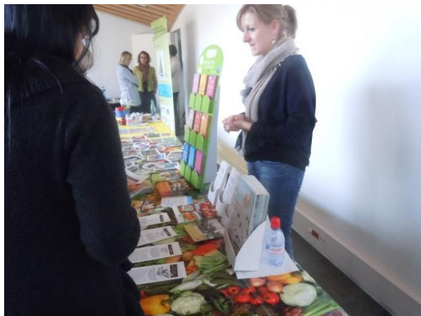
Stand sur les facteurs de risque et protecteurs