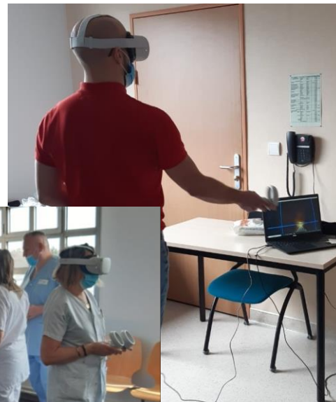
Casques virtuels sur le dépistage du cancer colorectal