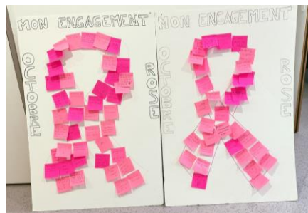
Mon engagement pour Octobre Rose